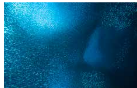
[Filippine] Cebu, Pescador Island: Banco di sardine nel blu