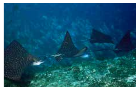
[Costarica] Coco Island: Aquile di mare