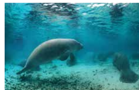
[Stati Uniti] Florida: Lamantini