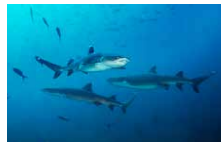
[Costarica] Coco Island: Squali pinna bianca