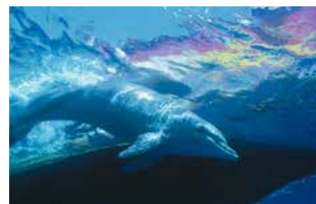
[Israele] Eilat: Delfino