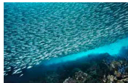
[Filippine] Cebu, Pescador Island: Banco di sardine sul reef