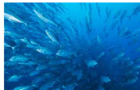
[Costarica] Coco Island: Banco di Carangidi