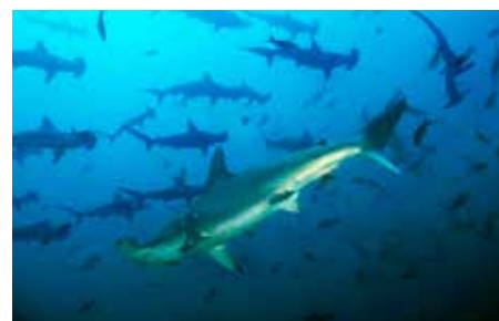
[Costarica] Coco Island: Squali Martello