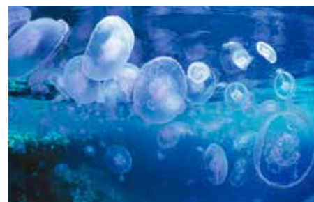
[Egitto] Mar Rosso, St. John Reef: Migrazione di meduse