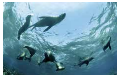
[Equador] Isole Galapagos: Otarie