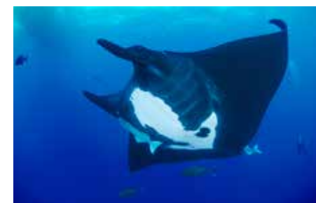
[Messico] Revillagigedo Islands, Isola di Santa Benedicta: Manta